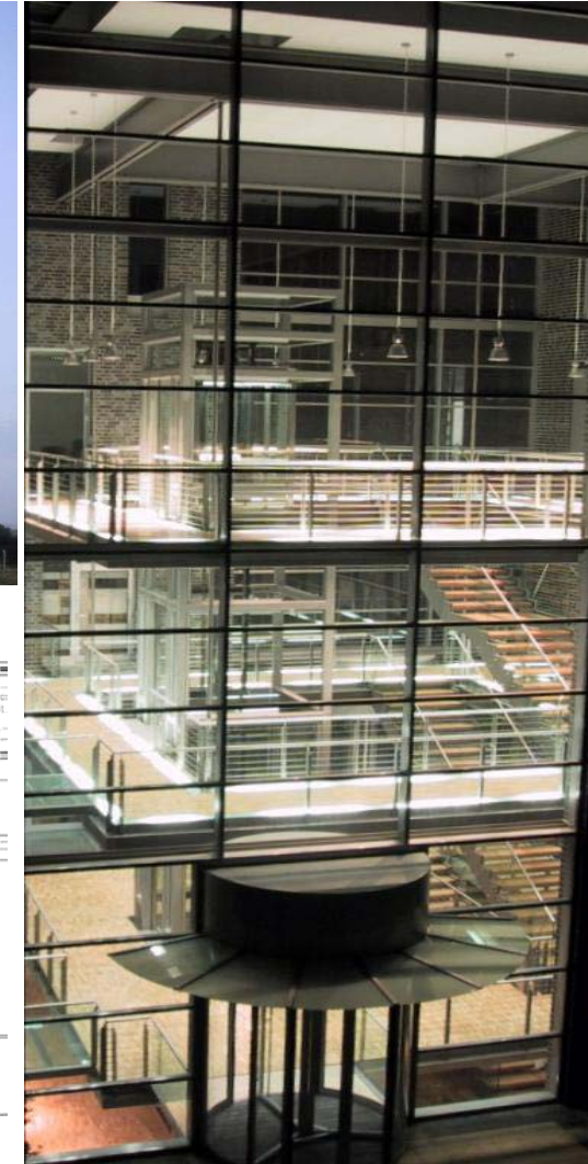
Gläsernes Treppenhaus mit abgehängten Treppenumgängen