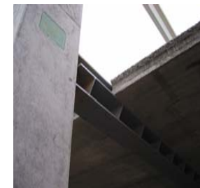
Stahlträger als Spannbetonfertig- teildeckenaufleger