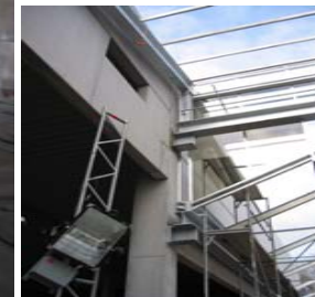
Übergang vom Massivbau zum Stahlbau