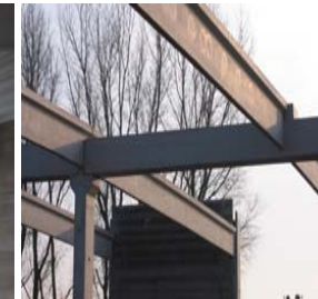
Auflager der Dachbinder