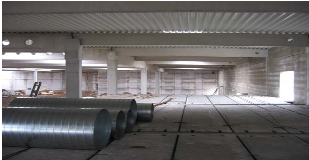
Blick von der Zwischenebene