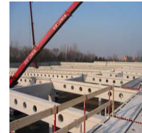
Spannbetonbinder, Länge 28,50 m