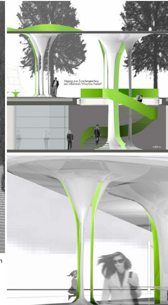
Schnitt Übergang U-Bahn